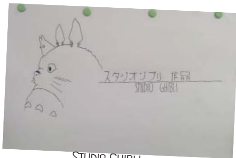
STUDIO GHIBLI - MAXIME BÉCU-MÉTAILLER TÈRE S2