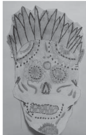
CHLOÉ LAMEUL - TÈRE L