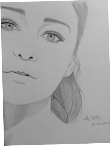
PORTRAIT D'EMILIA CLARKE - LILY-BELLE TÈRE S2